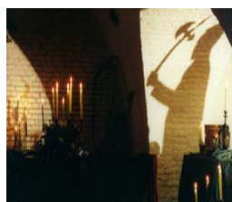
'Het gevaar dreigt'