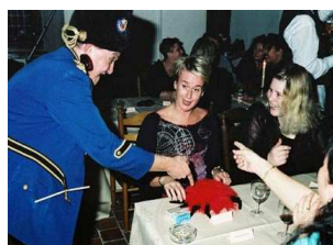
'Animatie aan tafel'

Uiteraard gaan ze op deze avond omzichtig te werk om niet uw argwaan te wekken en lijkt er dan ook ogenschijnlijk niets aan de hand. U wordt zelfs braaf van harte welkom geheten op het verjaardagsfeestje van Frolic, de zoon van baron 'Carl' en barones 'Kneveliëne' en daarbij uitgenodigd om feestelijk met de familie aan tafel te gaan. Er moet immers wat gevierd worden!