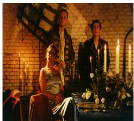
'Familie von Ramp'

Inleiding: Wenen, Oostenrijk, op de kop af precies 200 jaar geleden werd de veroordeelde Oostenrijkse geleerde Hyronimus van Ramp op het schavot terechtgesteld. De familie Von Ramp vluchtte vol schaamte het land uit en kwam in Nederland terecht. Sindsdien uit op eerherstel. De enige mogelijkheid daartoe is om de experimenten van Hyronimus af te maken om vervolgens voor een glorieus eerherstel terug te keren naar Oostenrijk.