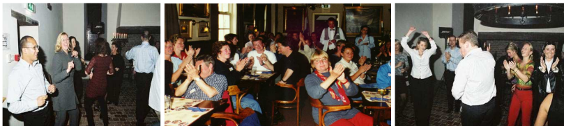
'Eind goed al goed met soms nog een feestje erna!'